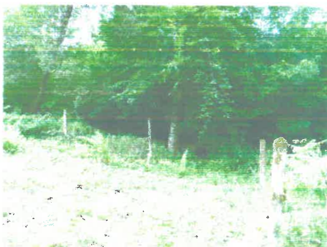
Photos du périmètre immédiat existant matérialisé par quelques piquets