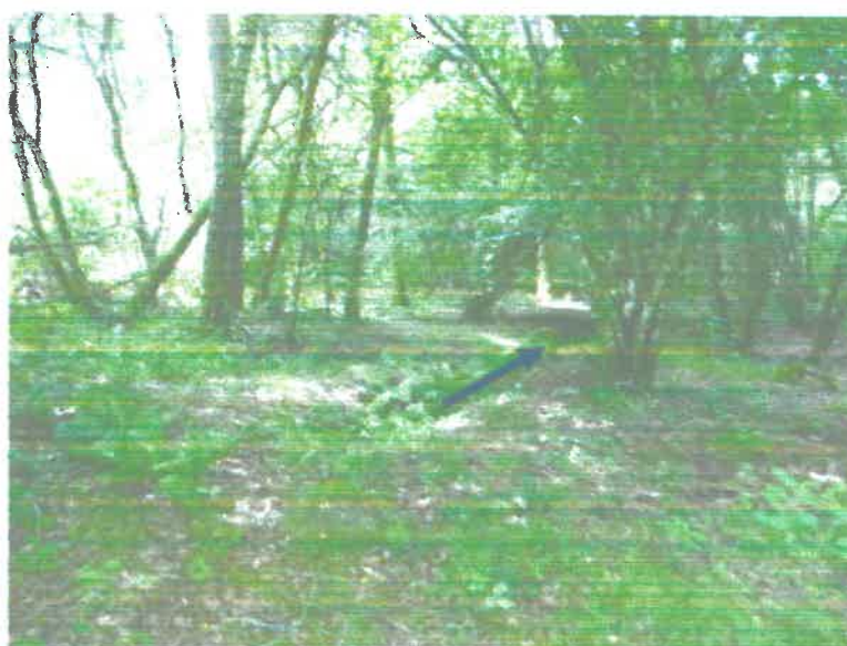
Zone d'écoulement du trop plein

Le captage de « Les Fayes », créé en 1975-1976, est implanté entre 550 et 600 m d'altitude. Le regard de captage et les drains du captage de « Les Fayes » se situent respectivement sur les parcelles 1a, 10d et 8a de la section cadastrale AH de La Villedieu.